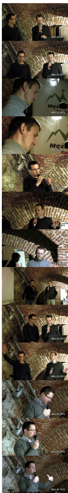
Transmisja live - zapis