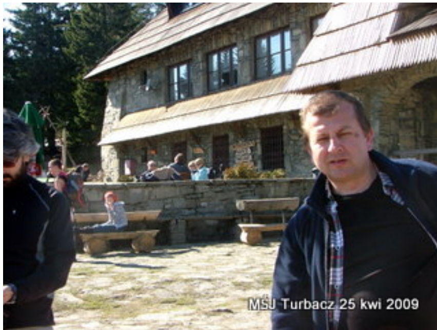
MŚJ Turbacz 25 kwi 2009