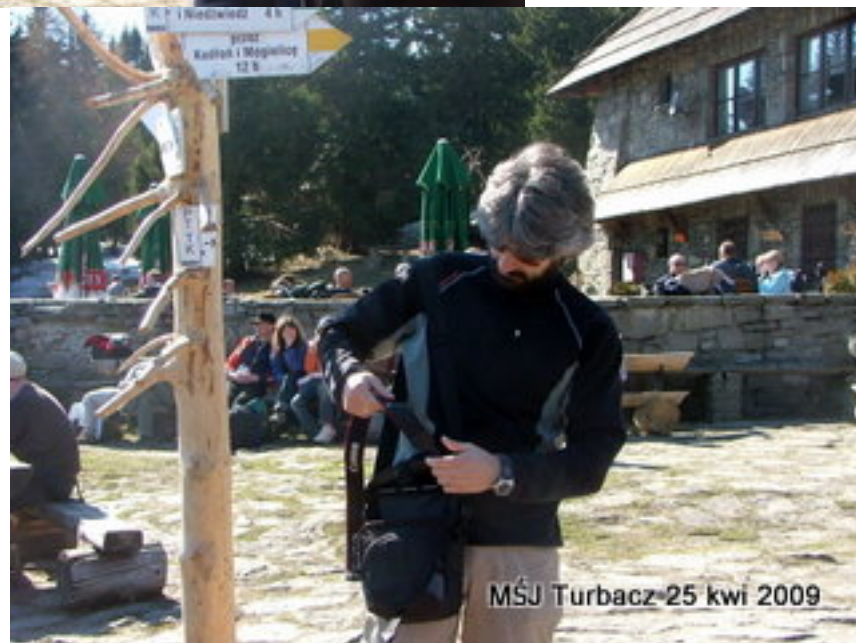
MŚJ Turbacz 25 kwi 2009