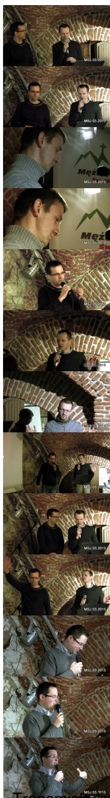
Transmisja live - zapis