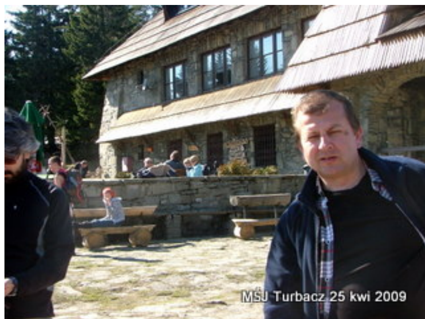
MŚJ Turbacz 25 kwi 2009