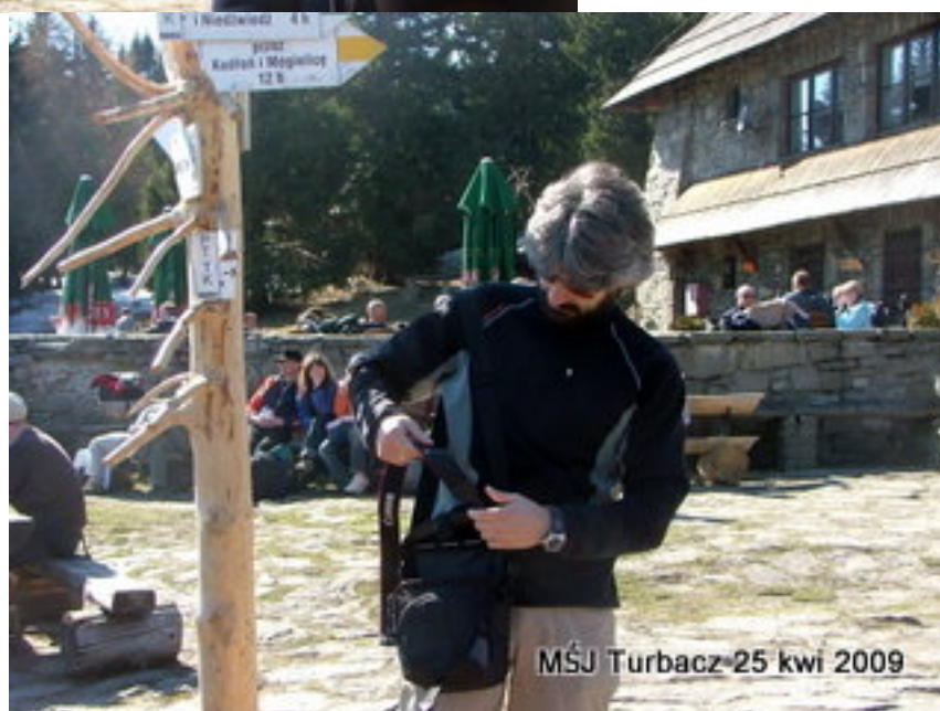
MŚJ Turbacz-25 kwi 2009